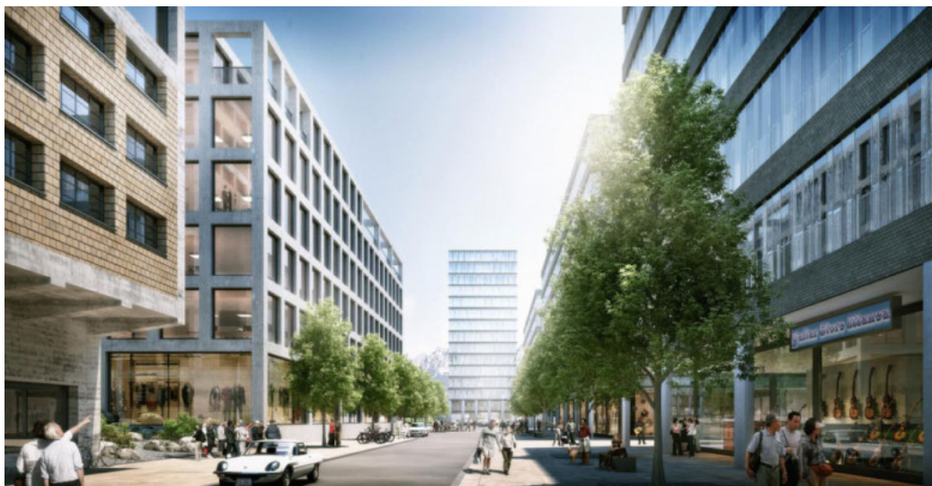
Visualisierungen, Raumgleiter GmbH | Situation, Fischer Architekten