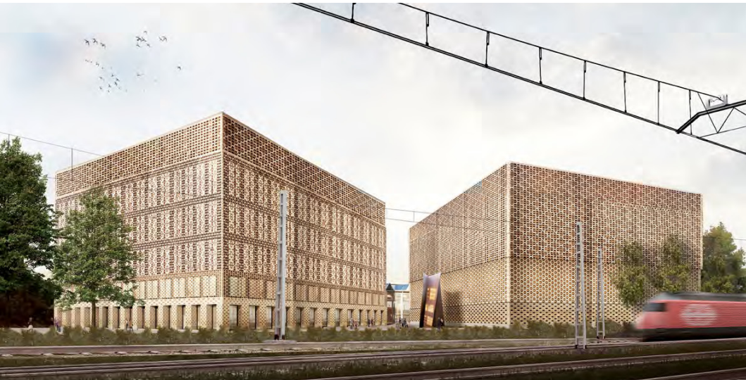
Pläne und Visualisierungen, Max Dudler Architekten